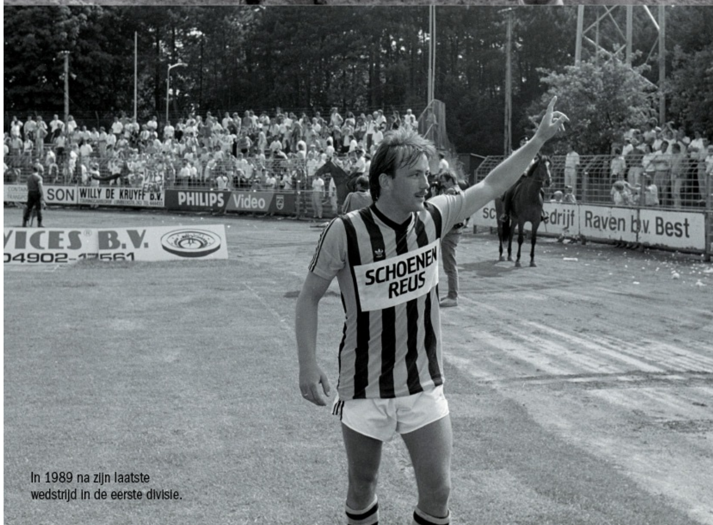
In 1989 na zijn laatste wedstrijd in de eerste divisie.