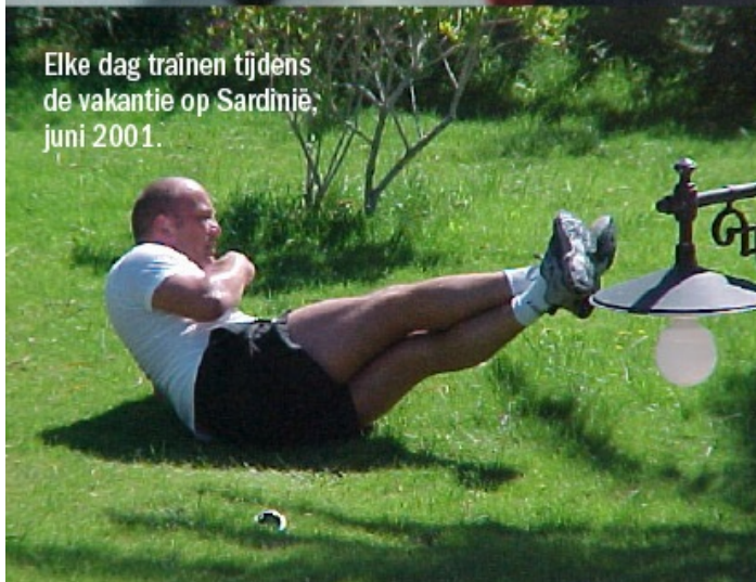
Elke dag trainen tijdens de vakantie op Sardinië, juni 2001.