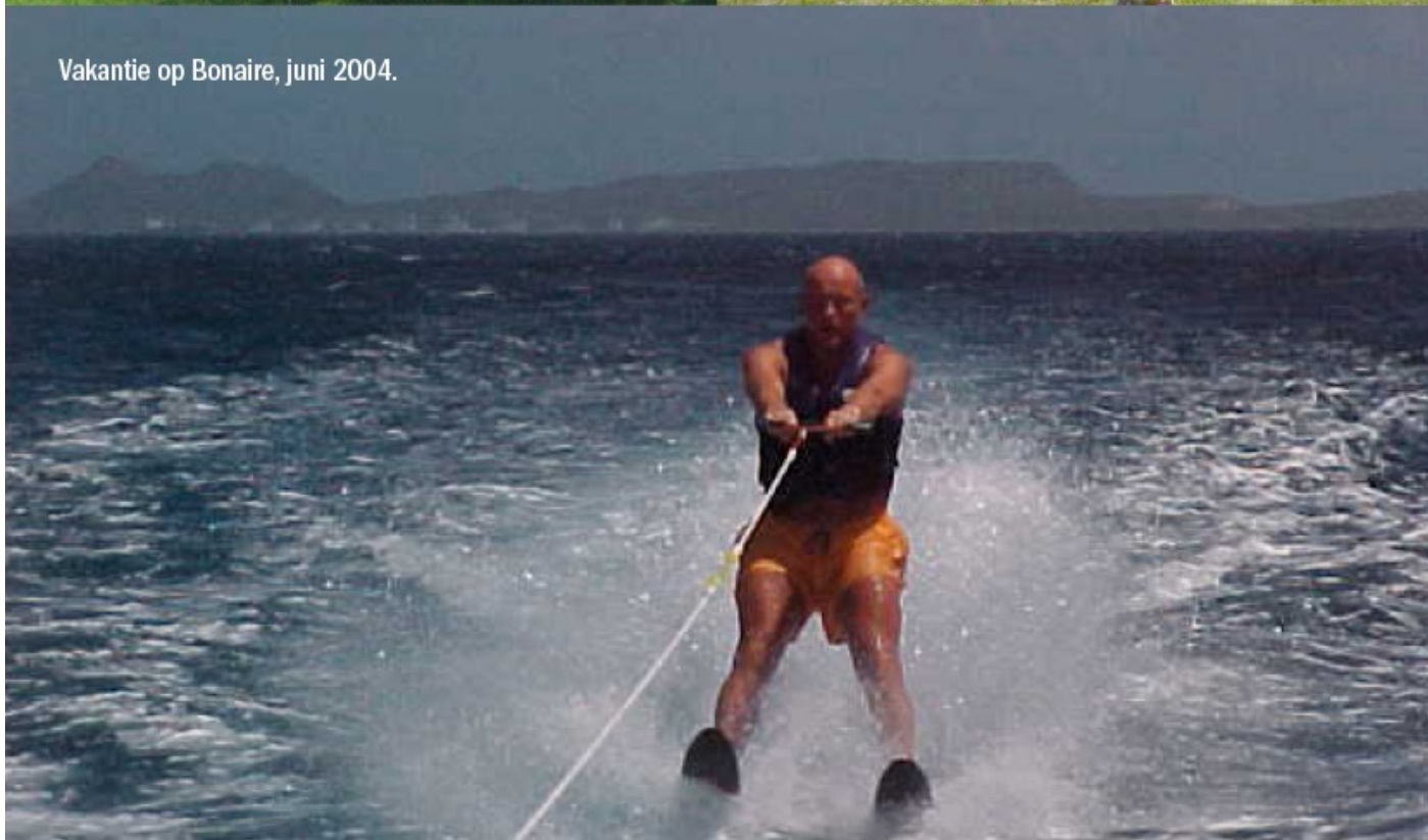
Vakantie op Bonaire, juni 2004.