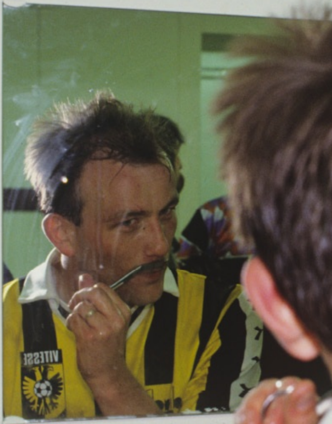
Snor eraf na plaatsing voor het UEFA Cup-toernooi 1991/92.