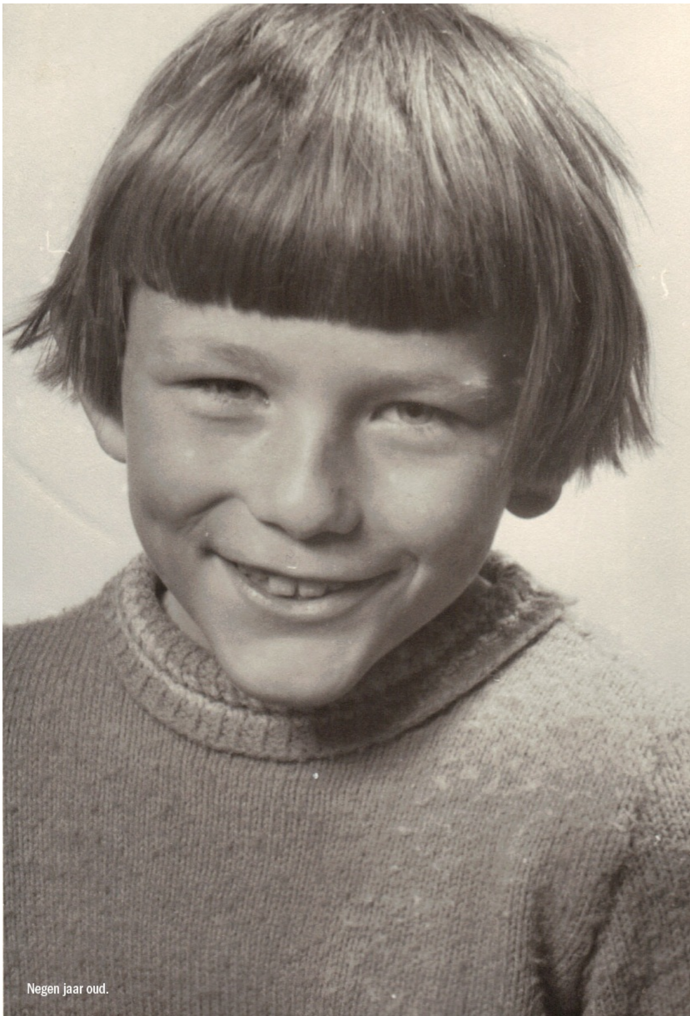
Negen jaar oud.