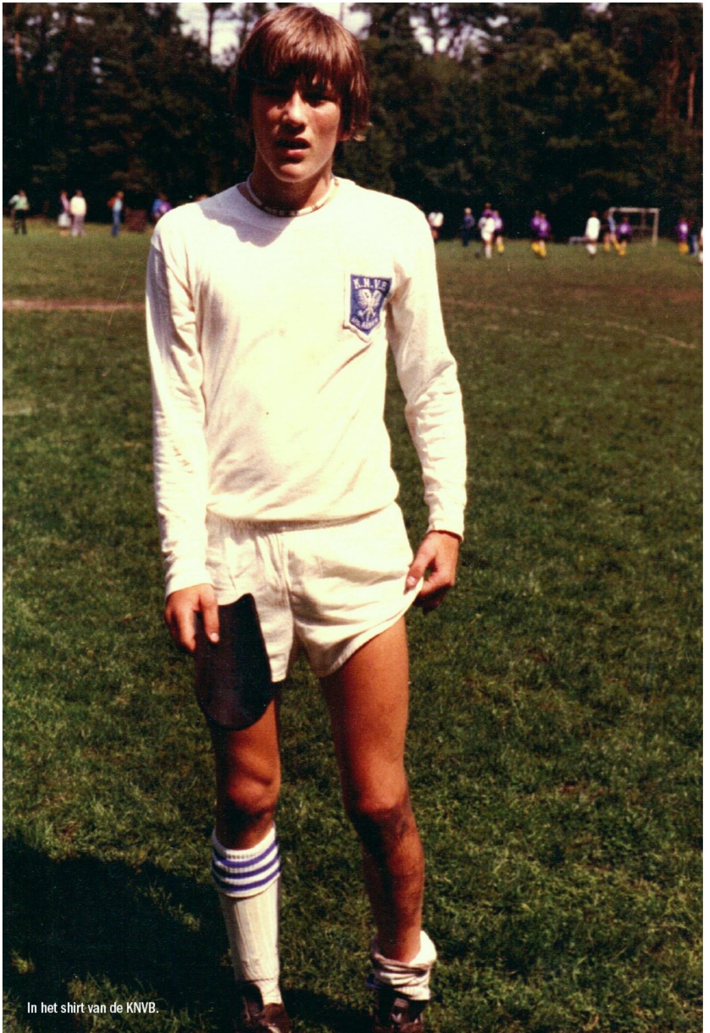
In het shirt van de KNVB.